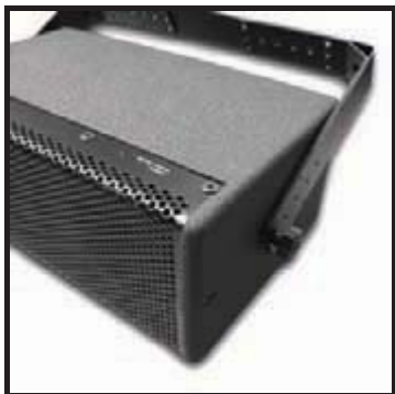
De l'assemblage complété.

Note: Des boulons et des rondelles supplémentaires fendues sont fournis si le VTC Pro Audio FF1 est montées de façon permanente et ne nécessite pas les boutons/boulons en plastique.